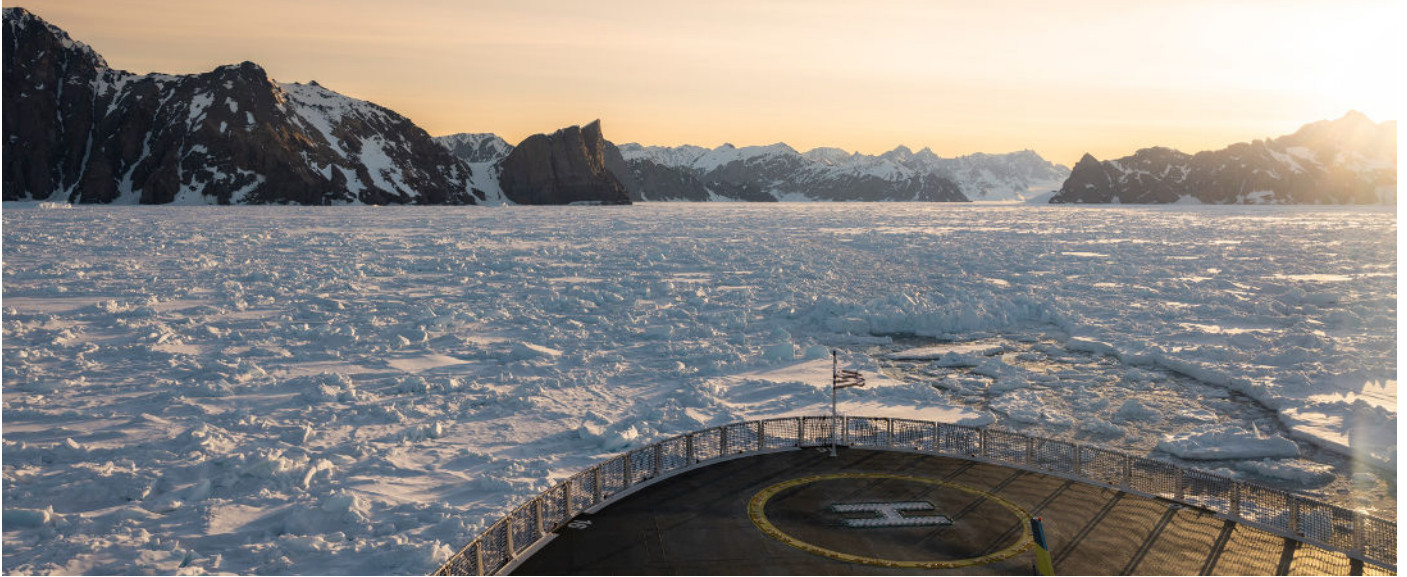
Die Magie der Mitternachtssonne – ein unvergesslicher Moment an Bord.