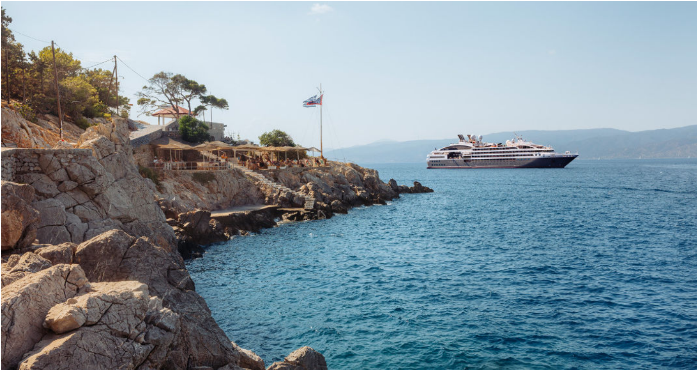
An Bord der Le Boréal die Sonnenfinsternis im Mittelmeer erleben

für zahlreiche Seevogelkolonien, begleitete Wanderungen erschließen die unberührte Natur der Färöer-Inseln und die Schätze der Shetlandinseln. Vor Heimaey können die Gäste das Naturphänomen der totalen Sonnenfinsternis erleben – in der exklusiven Begleitung von Jean-François Clervoy: Er ist Astronaut und Veteran von drei Missionen an Bord der Raumfähren Atlantis und Discovery und wird sein Fachwissen in Vorträgen und Begegnungen mit den Gästen teilen.