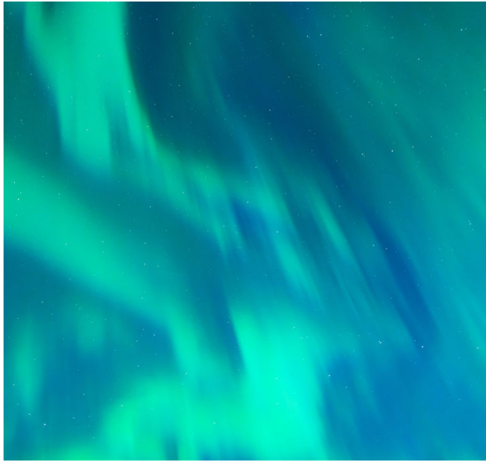
Faszinierendes Farbenspiel am nächtlichen Himmel des nördlichen Polarkreises.