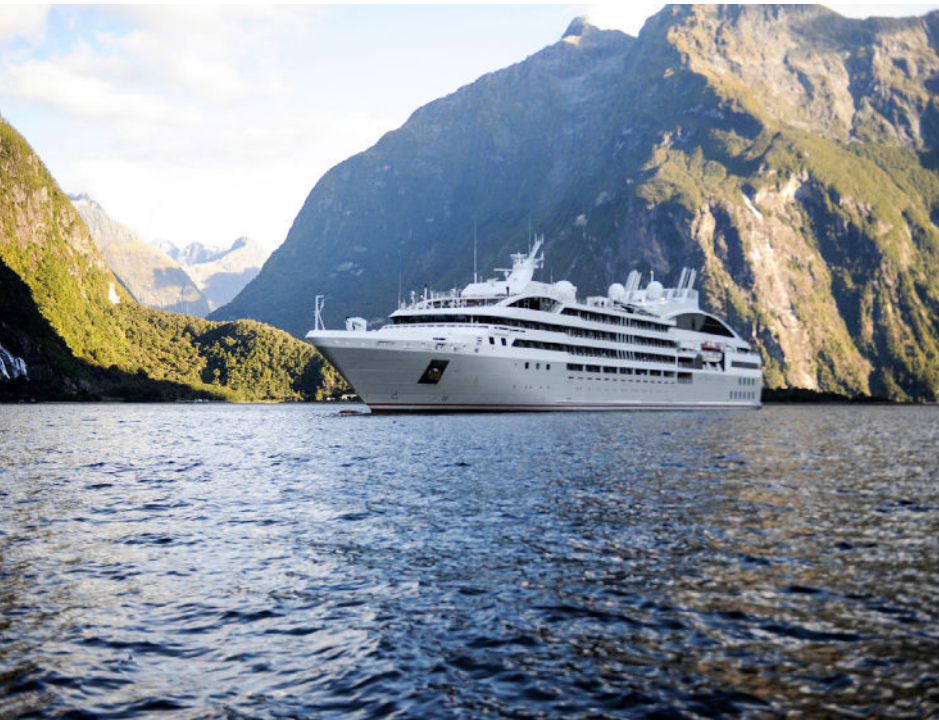
Neuseelands wilde subantarktische Inseln. 14 Nächte an Bord. Ab 11.530 Euro p.P.