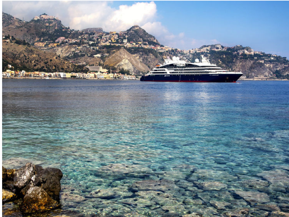
Antike Stätten, malerische Dörfer und wunderbare Landschaften von Malta über Italien bis Griechenland: 7 Nächte an Bord. Ab 5.670 Euro p.P.