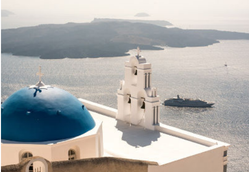
Im Herzen der griechischen Inseln. 7 Nächte an Bord. Ab 4.910 p.P.